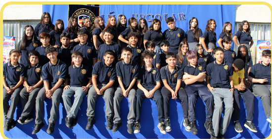
4TO BÁSICO 96% ASISTENCIA

Estos números muestran su dedicación diaria. Conserven esta disciplina. ¡Excelente trabajo!