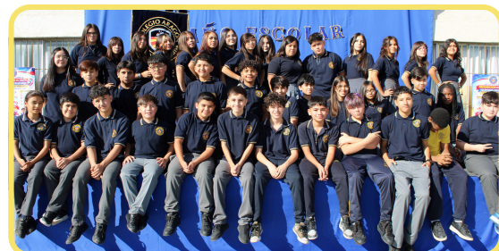
7MO BÁSICO 93% ASISTENCIA