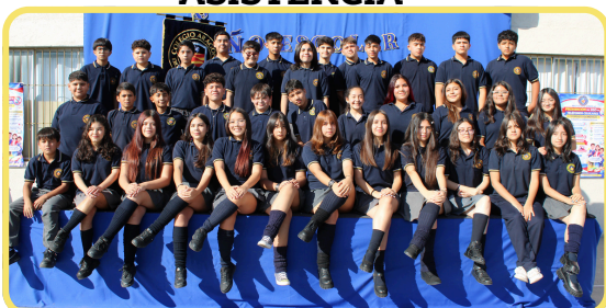
8VO BÁSICO 95% ASISTENCIA